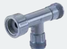
5. Reinwasser- Verteilerstück